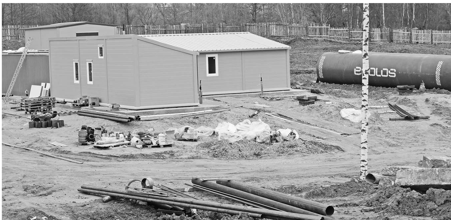
Стройплощадка очистных сооружений в п.Думиничи.