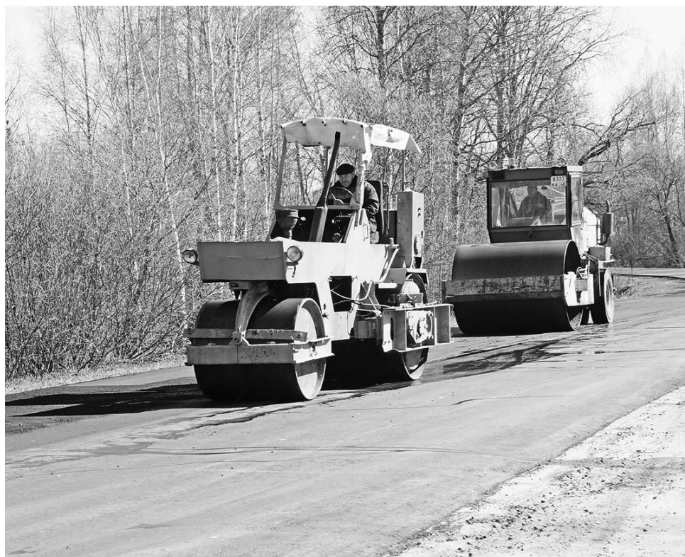
Ремонт дороги от трассы М3 до села Брынь.