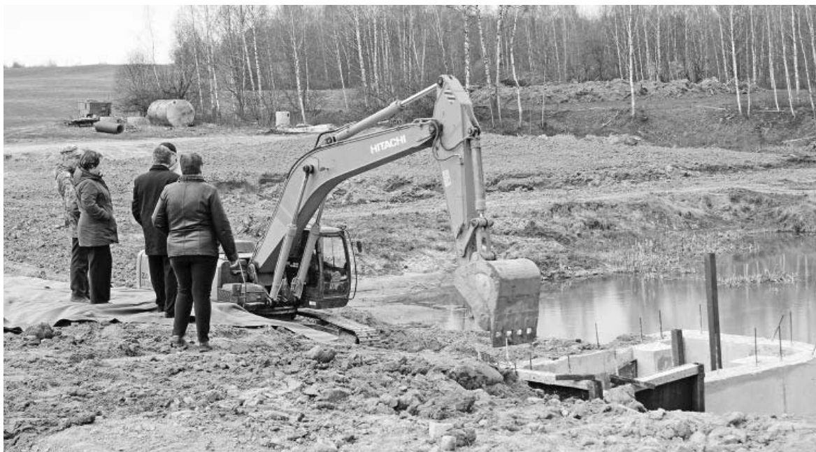
Строительство плотины в д.Гульцово.