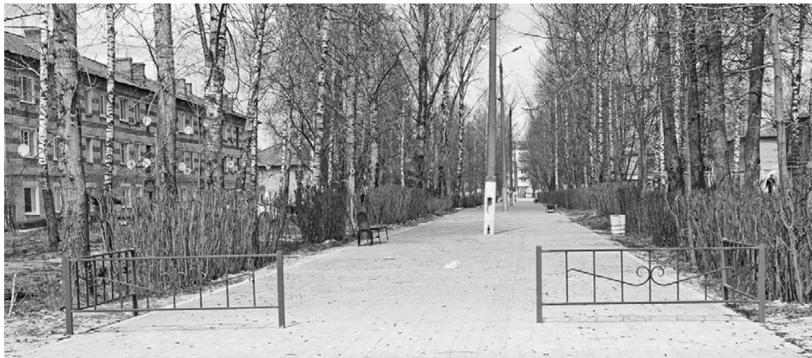
Аллея в селе Новослободск благоустраивается по программе «Комфортная среда».